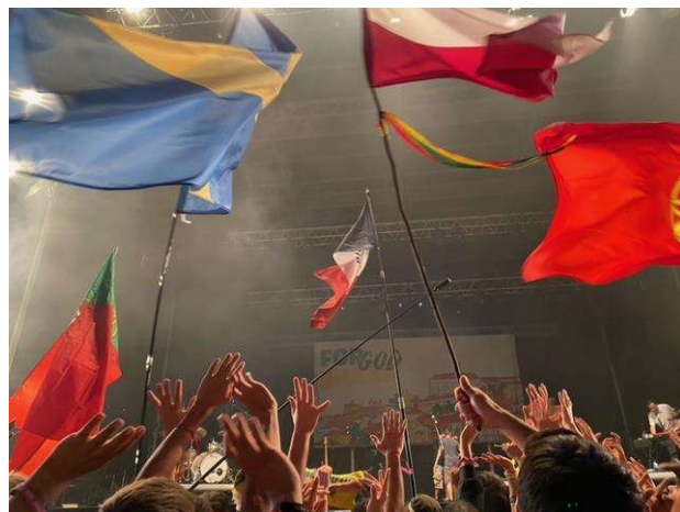
各国の旗を掲げて

15 日間 (17 日間) をともに過ごした日本公式巡礼団。新たな出会いや再会ができた WYD でした。