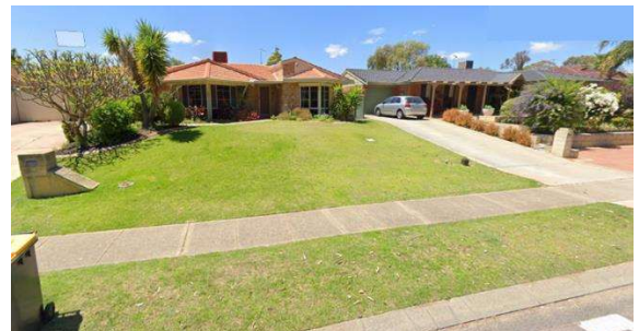
ホームステイ先に似た住宅（実物の写真ではありません）

平日は朝7時くらいに家を出て、バス停まで歩いていき郊外のバスターミナルに向かうバスに乗ります。だいたい15分くらいだったと思います。郊外のバスターミナルでダウンタウンに向かうバスに乗り換えますが、いろいろなところから来るバスから、みんなそのバスをめぐっていくので長蛇の列になります。来たバスに乗ればよいのですが、座れるか座れないかが重要なので、満員のときは次のバスを待ちます。車通勤の人も多いので、ダウンタウンの5kmくらい手前からは、毎日渋滞します。帰りは20分くらいで着くのですが、朝は1時間くらいかかっていたと思います。ですから、座れるか座れないかは重要なわけです。