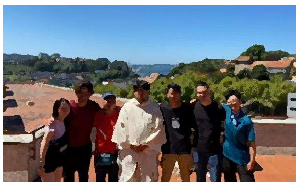
さいたま教区巡礼団

私は日本公式巡礼団で参加しました。札幌教区から那覇教区の人まで、日本全国からの参加者とともに15日間(時差の関係で17日間)過ごしました。